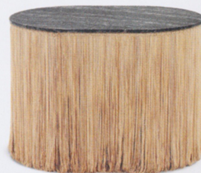
TABLE BASSE TRIPOLINO S

En laine tissée à la main, design Sebastian Herkner pour Ames Sala, à partir de 729 €. ↘ ames-shop.de